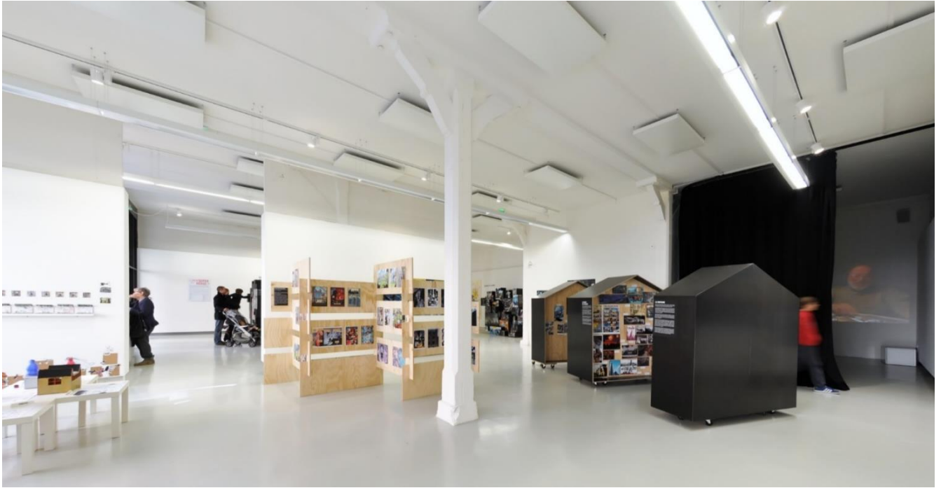
Salle d'exposition du Forum