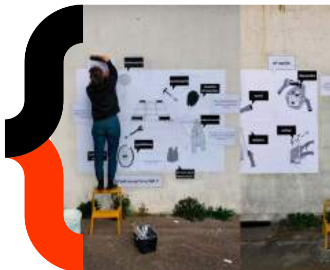
Tabula non Rasa - 2024

Afin de permettre à tous de suivre le déroulement des résidences, chaque équipe créera et alimentera un site/blog dédié à la résidence et pourra produire un support de synthèse présentant leur démarche et leurs réalisations.