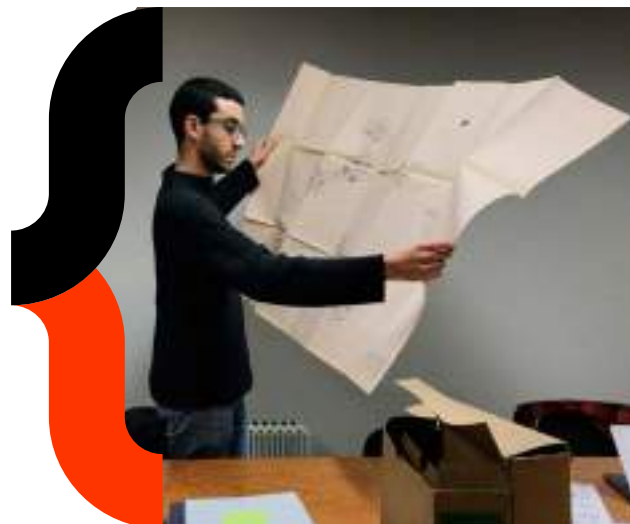
Bonneville – Le quartier des Îles - 2020

L'équipe qui les entoure peut être à géométrie et professions variables, offrant ainsi des points de vue et des méthodes de travail variés et complémentaires .