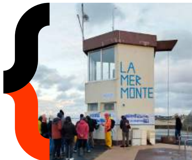
Laboratoire du littoral - Bessin - 2024

Des formats expérimentaux court ou long en collectif ou en binôme, en itinérance.