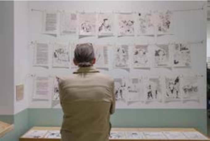
Exposition SeineTOPIE à la MaN

Habiter c'est la manière dont nous faisons de chaque lieu un chez-soi, tout en participant à la vie collective et à la transformation du monde qui nous entoure.