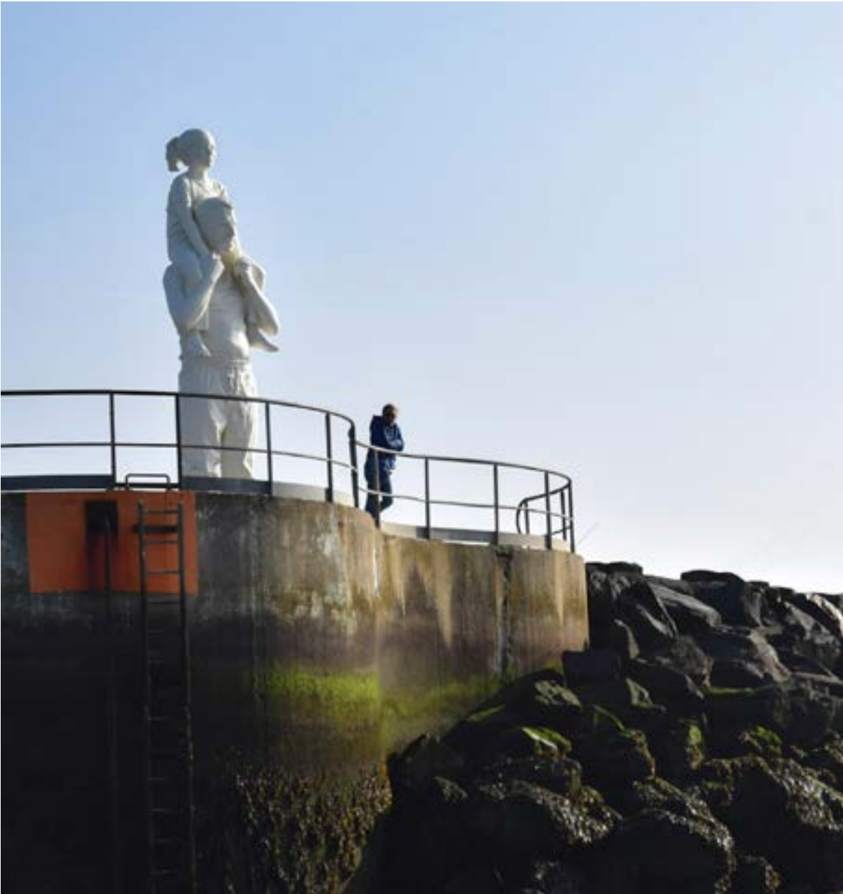
De la skyline de Newyork aux silhouettes havraises

Intégrer dans les projets de ZIGZAG des promenades architecturales, des lectures de paysage, des ateliers participatifs autour du fleuve permet de rendre tangible cette dimension.