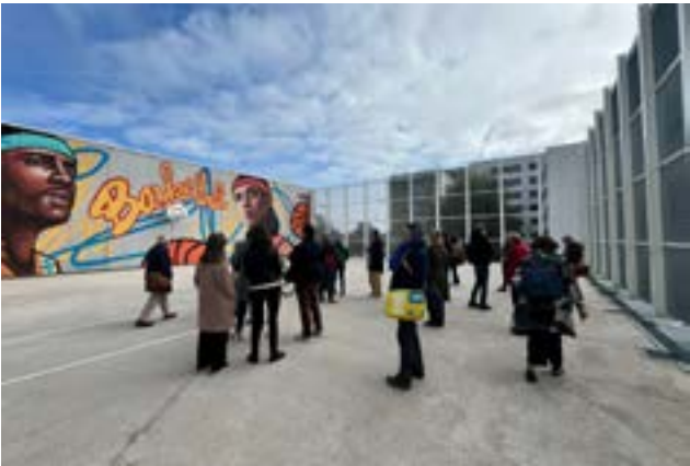
Visite de l'opération Un cinéma réinventé au Havre